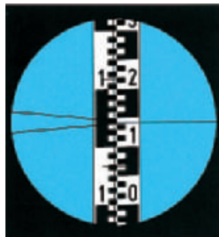
Campo visual del NA2, con mira de nivelación. Lectura en el trazo hz, 1,143 m

El modelo NAK2 tiene un círculo horizontal de vidrio, herméticamente cerrado. Con ayuda de un anillo moleteado se le puede colocar sobre cualquier lectura de partida, lo cual resulta ventajoso al replantear ángulos. Está dividido en grados enteros y se lee en un microscopio de escala situado a la izquierda del ocular del anteojo. Midiendo dirección, distancia y altura es posible levantar o replantear la posición de puntos de detalles en terreno llano.