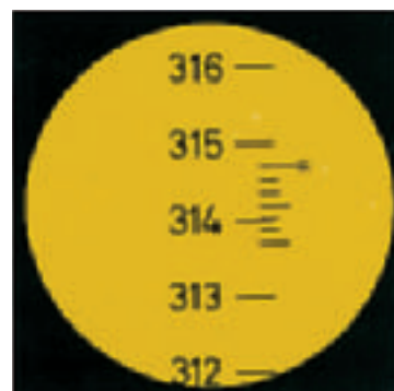
Lectura del círculo horizontal con el NAK2: (360°) 314°42'